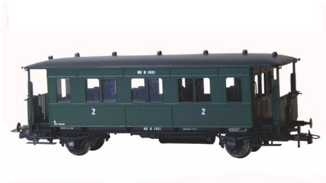
Kit 201B rijtuig Haarlemmermeer (2° Klasse) Nu leverbaar