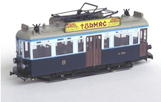
kit004A NZH A250 "Cardanwagen" Haarlem en Leiden