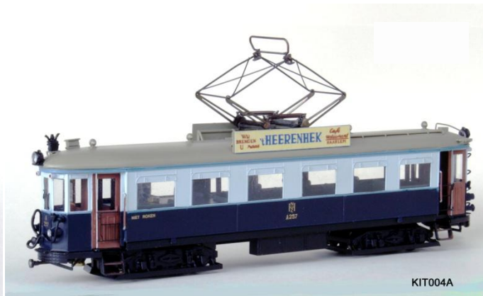
Kit 004A NZH A250 "Pannebrood"