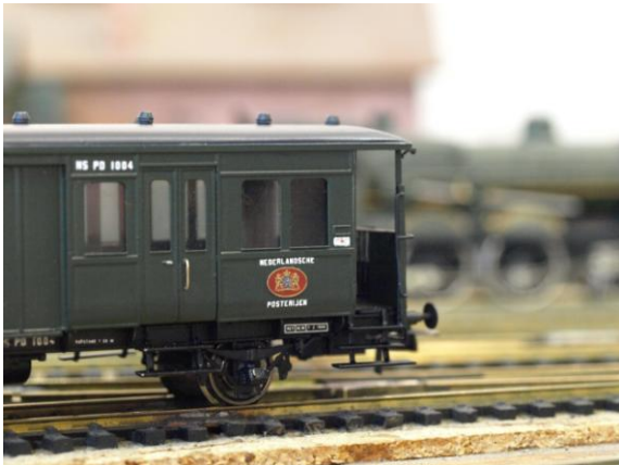
Kit 201PD Rijtuig Haarlemmermeer (post/goederen)