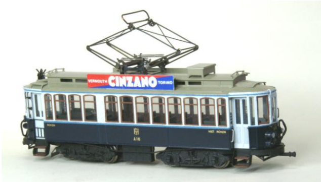
Kit 002A NZH Kikker (Zandvoorter en Waterlander)