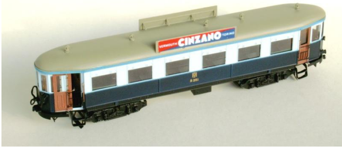
Kit 004B NZH B251 Bijwagen "Pannebrood"