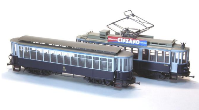
Kit 002B NZH Hamburger (bijwagen Kikker, Boedapester, enz.)