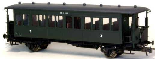
Kit 201C Rijtuig Haarlemmermeer e.d. (3° Klasse)