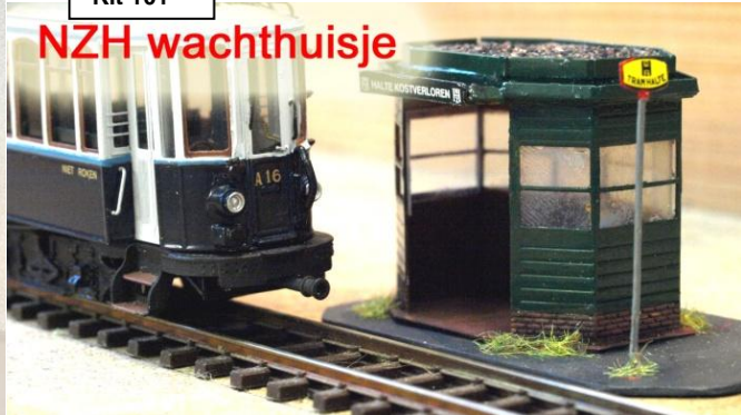
Kit 101 8-kantig wachthuisje "type D"